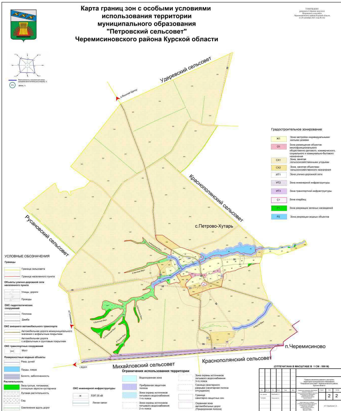
Рис.2. Карта границ зон с особыми условиями использования территории муниципального образования «Петровский сельсовет» Черемисиновского района Курской области